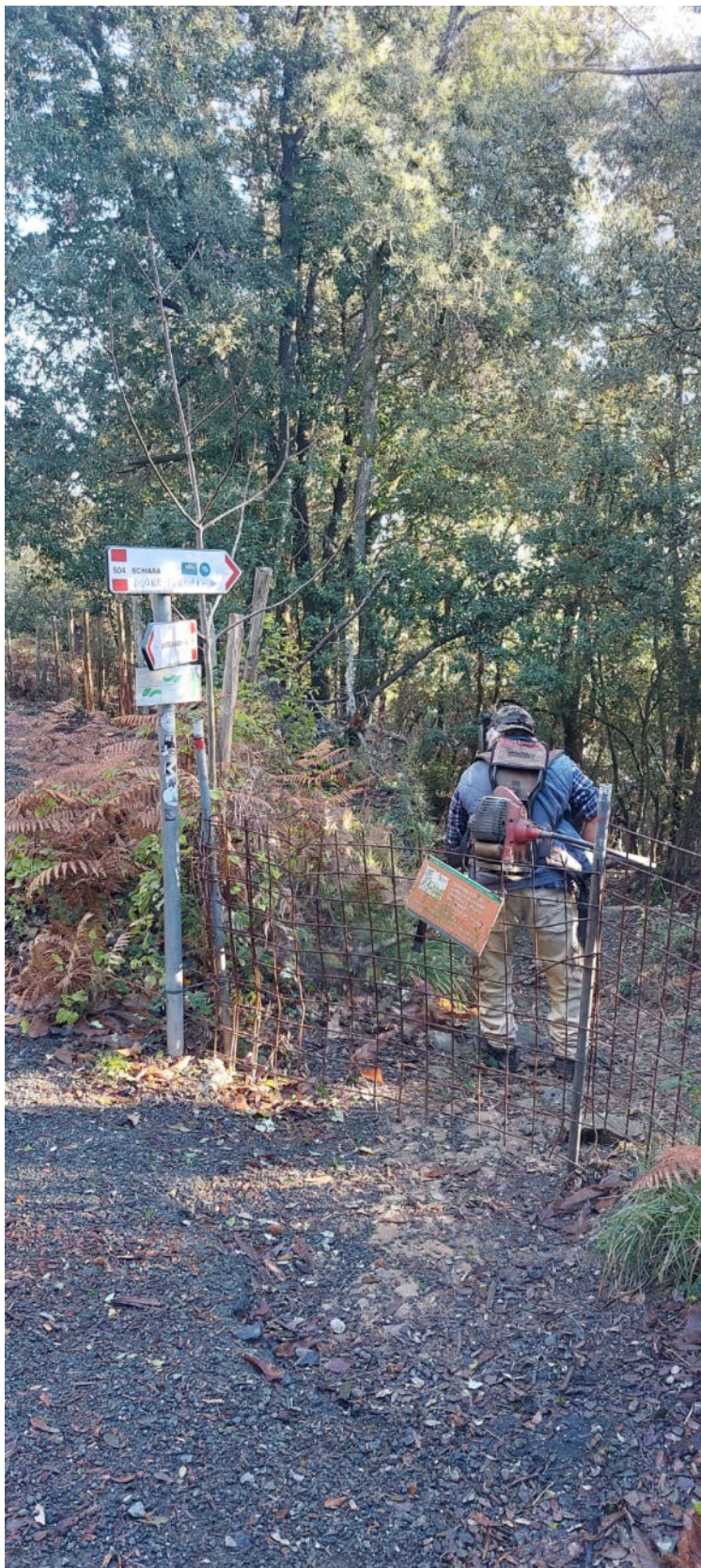
"Valorizzazione dei collegamenti tra sito e buffer zone: proseguo dei lavori di pulizia dei sentieri" finanziato ai sensi della L. 77/2006 con D.M. 27 gennaio 2023 n. 40 a valere sul Cap. 1442 - E.F. 2022

tel. +39 339 7996920 ✦ e-mail: protocollo@pec.comune.portovenere.sp.it ✦ nicoletta.portunato@comune.portovenere.sp.it internet: www.portovenerecinqueterreisle.com