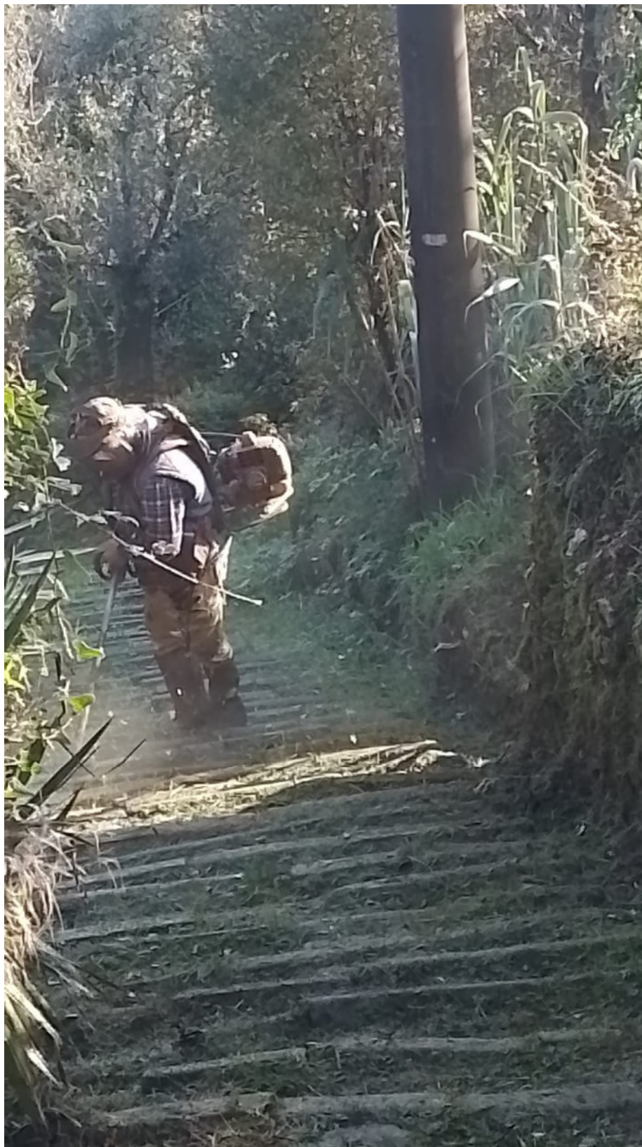
"Valorizzazione dei collegamenti tra sito e buffer zone: proseguo dei lavori di pulizia dei sentieri" finanziato ai sensi della L. 77/2006 con D.M. 27 gennaio 2023 n. 40 a valere sul Cap. 1442 - E.F. 2022

tel. +39 339 7996920 ✦ e-mail: protocollo@pec.comune.portovenere.sp.it ✦ nicoletta.portunato@comune.portovenere.sp.it internet: www.portovenerecinqueterreisle.com