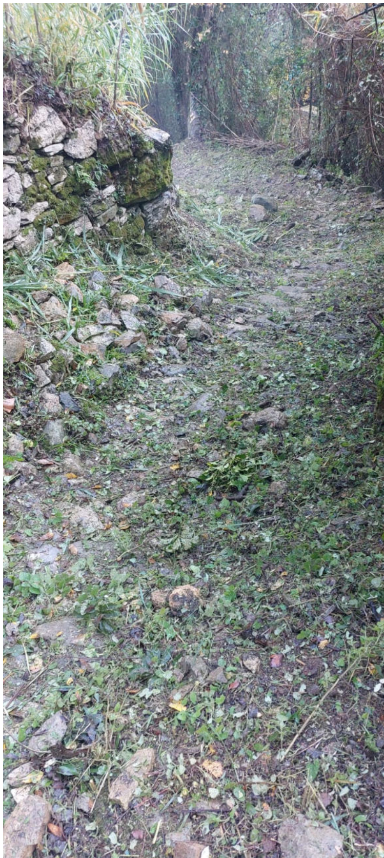
"Valorizzazione dei collegamenti tra sito e buffer zone: proseguo dei lavori di pulizia dei sentieri" finanziato ai sensi della L. 77/2006 con D.M. 27 gennaio 2023 n. 40 a valere sul Cap. 1442 - E.F. 2022

tel. +39 339 7996920 ✦ e-mail: protocollo@pec.comune.portovenere.sp.it ✦ nicoletta.portunato@comune.portovenere.sp.it internet: www.portovenerecinqueterreisle.com